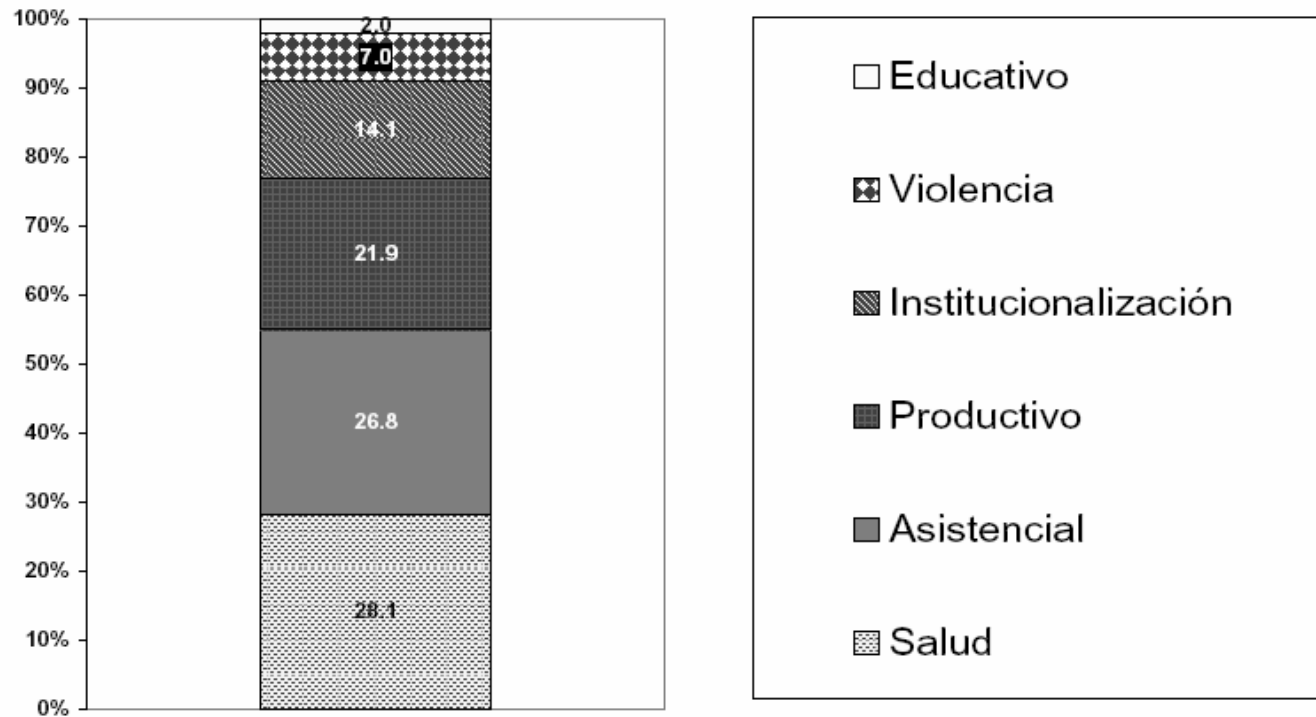
Gráfica 2. Porcentaje del Gemeg por tema en el PEF 2008

Fuente: CEAMEG, con base en cifras del PEF 2008 publicados por SHCP.